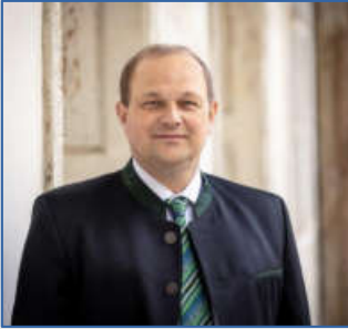
Bürgermeister Klaus Strein

Mureck ist eine malerische Stadt in der Südsteiermark, die von der Mur durchzogen wird und von grünen Hügeln umgeben ist. Die historische Altstadt und die idyllische Lage machen sie zu einem beliebten Ziel für Naturliebhaber und Erholungssuchende.